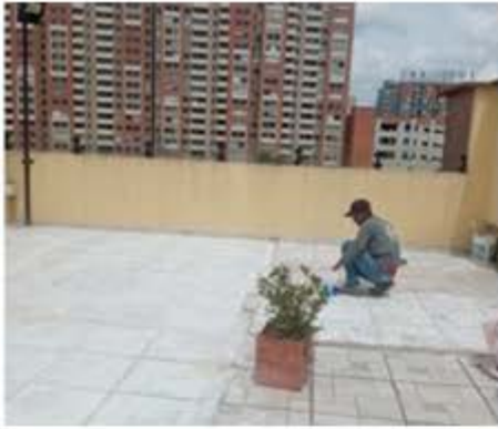
MANTENIMIENTO TERRAZA BBQ